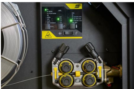
Luokansa paras langansyöttömekanismi