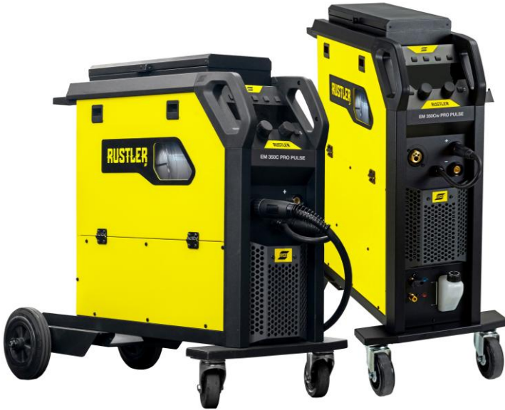
Rustler EM 350C / 350Cw PRO Pulse