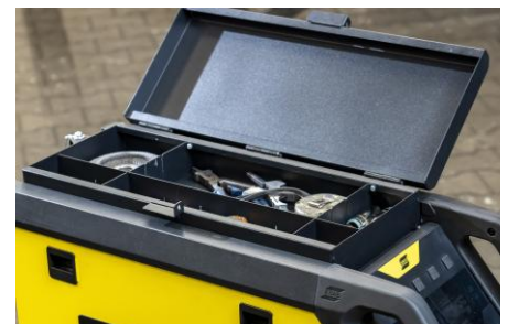
Lisävarusteena ylätyökalulaatikko lisävarusteita varten