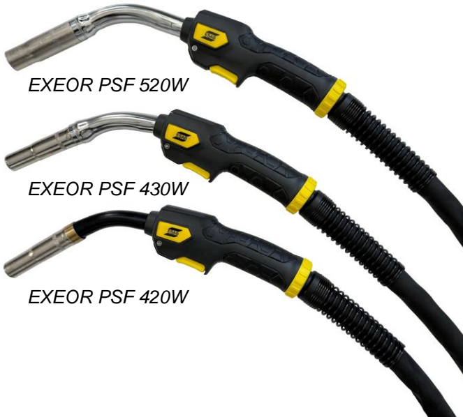
EXEOR PSF 520W