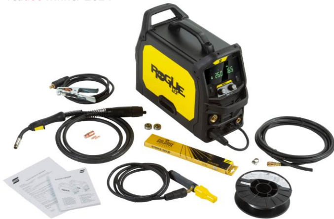
Rogue EM 180