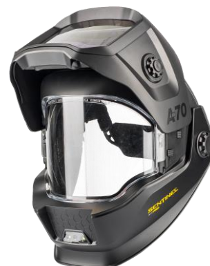
Sentinel A70 Pro