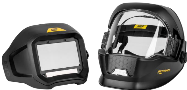
Sentinel A70 Pro – irrotettava ADF-lasi